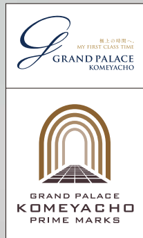
image photo グランドパレス米屋町 検索 第一交通産業株式会社

ご好評につき 住宅ローン相談会 開催中 銀行の比較・フラット35・ローンの上限額など... お気軽にご相談ください。